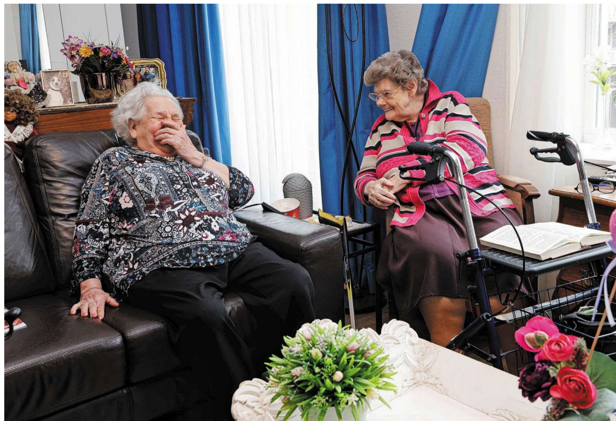
De kloof tussen vraag en aanbod in de ouderenzorg neemt snel toe.