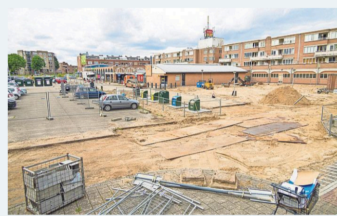
In delen wordt de parkeerplaats rond winkelcentrum Oostermeent aangepakt.